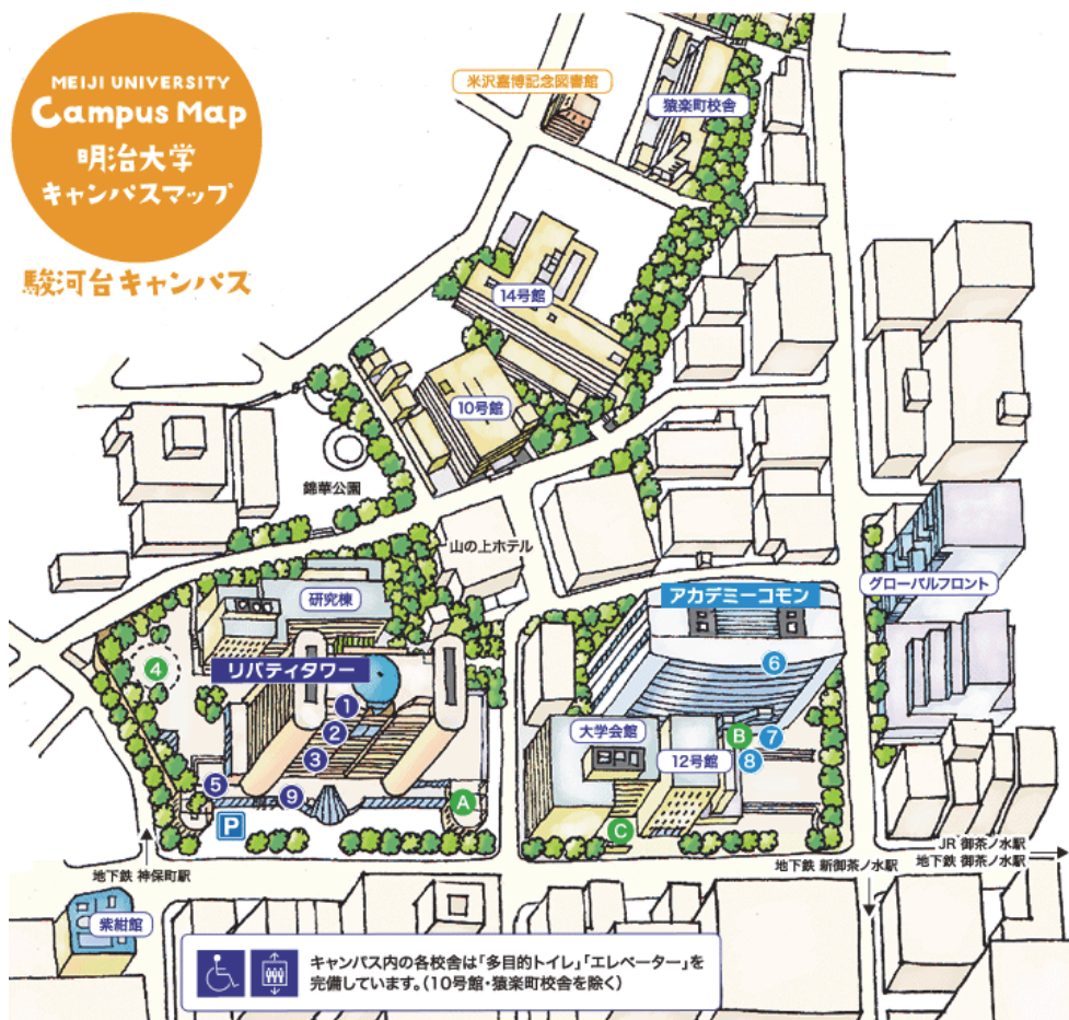
明治大学キャンパスマップ